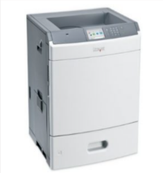
Modèle d'imprimante SFP

Lignes directrices pour l'emballage d'une imprimante monofonctionnelle (SFP) ou multifonctionnelle (MFP) de table