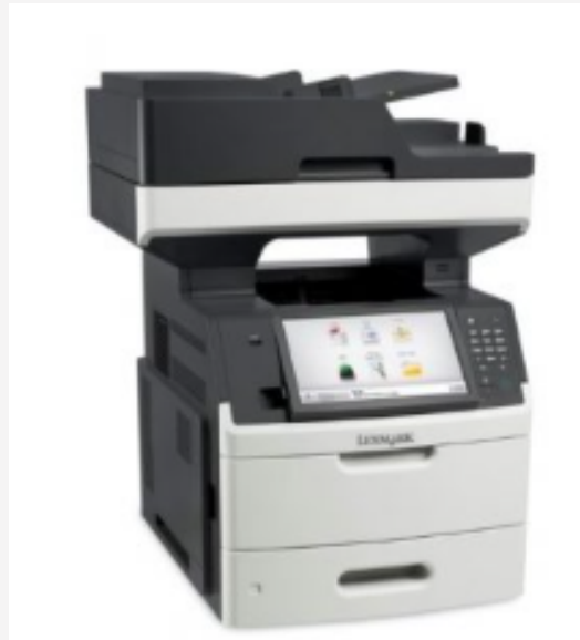
Modèle d'imprimante MFP